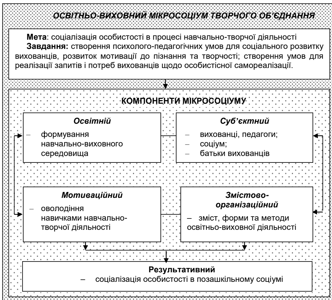
Рис. 1. Соціально-педагогічна модель творчого об'єднання «Паперова пластика»

Зазначене вище дало підстави для розроблення соціально-педагогічної моделі організації роботи творчого об'єднання «Паперова пластика» (рис.1).