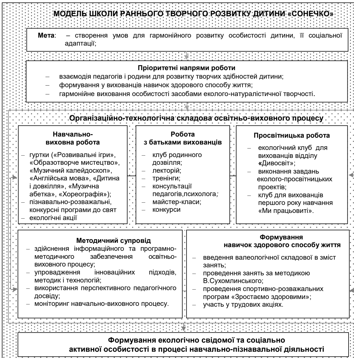
Рис. 1. Модель школи раннього творчого розвитку дитини «Сонечко»

Творчі завдання, дидактичні ігри, досліди, спостереження за живою природою, догляд за тваринами в живому куточку забезпечують не лише розвиток здібностей і нахилів вихованців, а й сприяють їхньому подальшому самовизначенню та самореалізації.