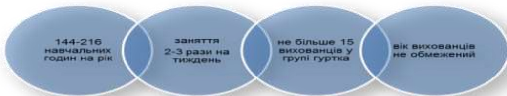
Рис. 3. Особливості навчально-виховного процесу в позашкільному навчальному закладі

Організація навчання декоративно-ужиткового мистецтва в позашкільному навчальному закладі має свої особливості (рис. 3).