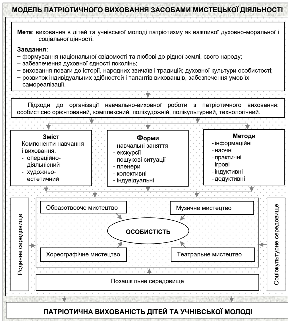
Рис. 1 Модель патріотичного виховання засобами мистецької діяльності

також виховує волювати якості, сприяє пізнанню навколишнього світу, становленню гармонійної особистості.